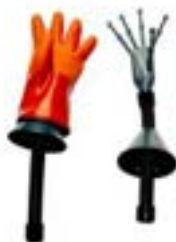
OSMA Handschuhaufsätze ideale Ergänzung zu OSMA Schuhtrocknersystemen (ab € 70,18 exkl.)