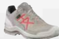
330145 / beige-scarlet UK 3 – 9