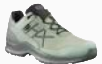
330141 / clay-sage UK 6 – 12