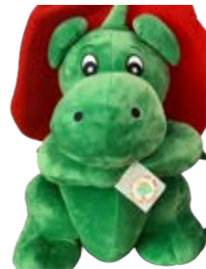
Grisu Plüschtier 20cm