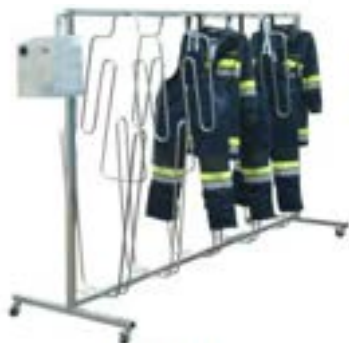
Fireman das ideale Gerät zum Innentrocknen schwerer Schutzbekleidung (ab € 2.753,58 exkl.)