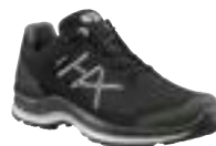
330139 / black-silver UK 6 – 12