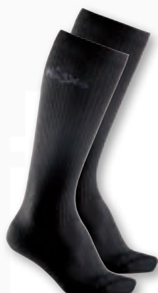
Multifunktionsstrumpf Art. Nr.: 901070

Größen: S 37–39 / M 40–42 / L 43–45 / XL 46–48