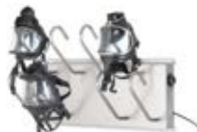
Maskentrockenhalter in verschiedenen Größen (ab € 768,88 exkl.)