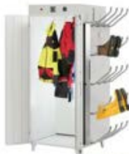
Trockenschränke in verschiedenen Größen und Ausführungen (ab € 3.766,65 exkl.)