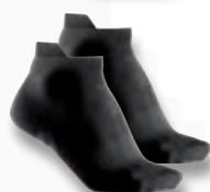
Athletic Socken Art. Nr.: 901090