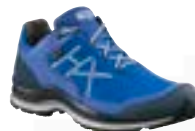
330143 / azure-silver UK 6 – 12 Extra UK 13/14/15