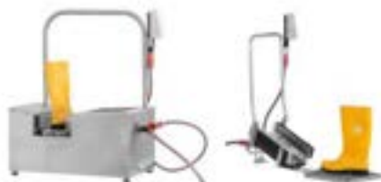
Stiefelwascher in verschiedenen Größen und Ausführungen (ab € 385,06 exkl.)