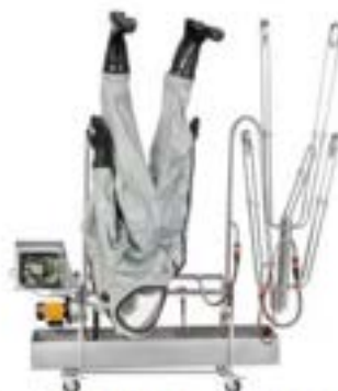
OSMA Wasch-, Desinfizier- und Trockenstation in verschiedenen Größen und Ausführungen (ab € 3.466,55 exkl.)