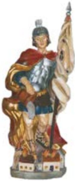
Hl. Florian Statue