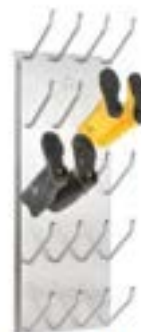
Schuh- und Stiefeltrockner in verschiedenen Größen und Ausführungen (ab € 225,93 exkl.)