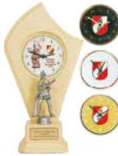
Uhr aus Holz