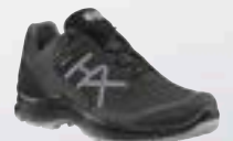
330144 / onyx-midnight UK 3 – 9