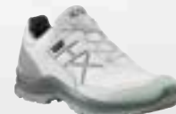
330146 / snow-sage UK 3 – 9