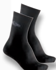
Multifunktionssocken Art. Nr.: 901015