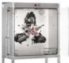
Maskentrockengeräte in verschiedenen Größen und Ausführungen (ab € 3.682,52 exkl.)