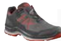
330140 / graphite-orange UK 6 – 12